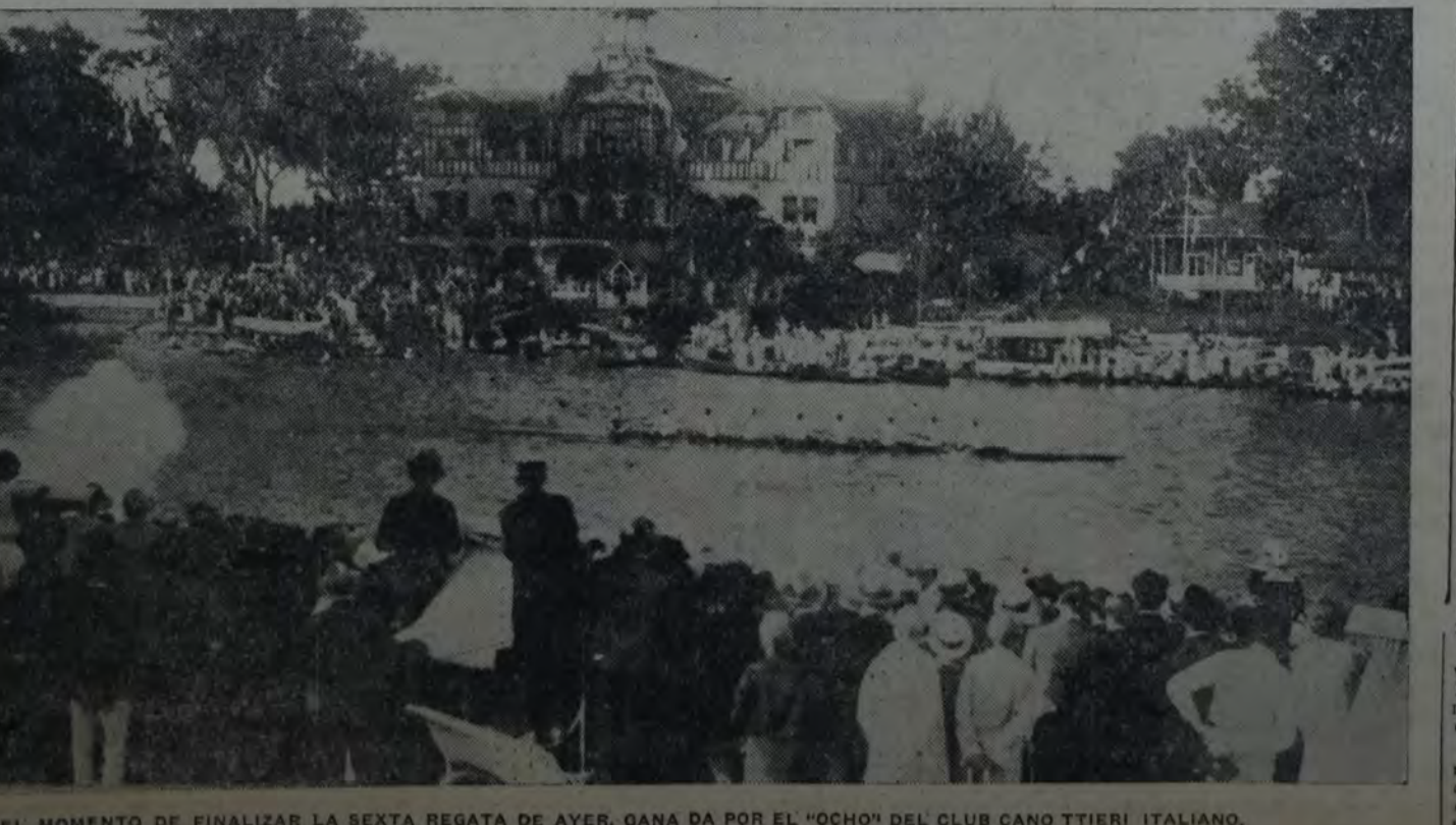
EN EL MOMENTO DE FINALIZAR LA SEXTA REGATA DE AYER, GANA DA POR EL "OCHO" DEL CLUB CANOTTIERI ITALIANO.

Fués, sin discusión alguna, el partido más memorable del campeonato que tan brillantemente conquistaron los jugadores argentinos en la VIII disputa por el trofeo Copa Mitre.